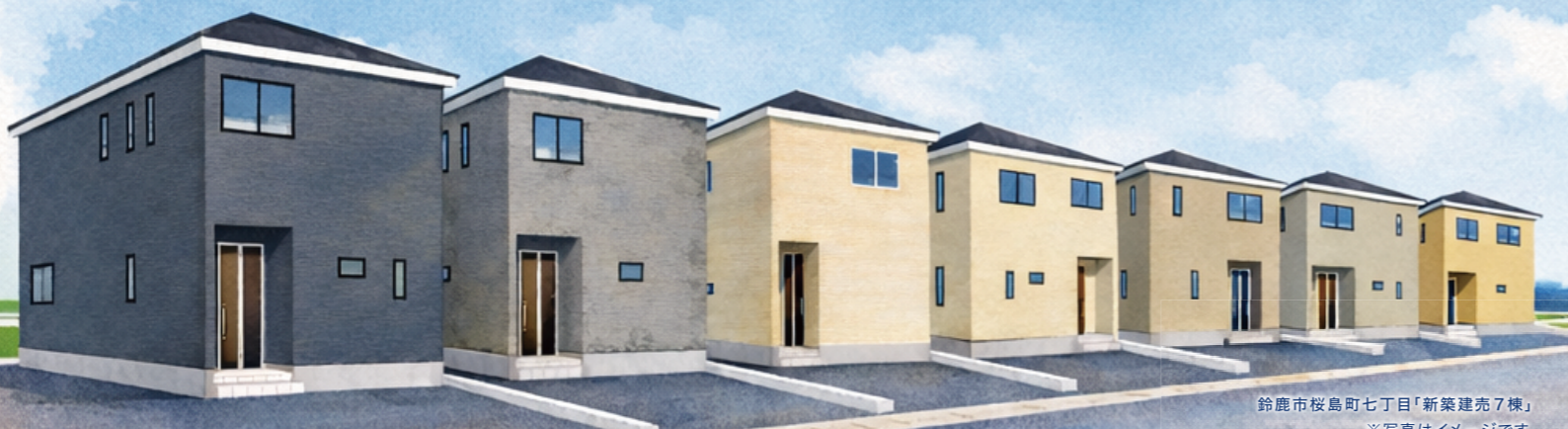
鈴鹿市桜島町七丁目「新築建築7棟」 ※写真はイメージです