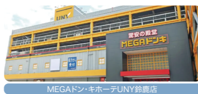
MEGAドン・キホーテUNY鈴鹿店 約2,100m(徒歩27分)